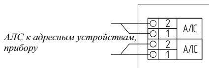
АЛС к адресным устройствам, прибору